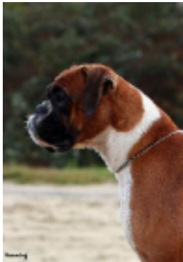
Blöf's Ninthe van de Legedyk Wurftag: 02.05.2005 AKz: BH