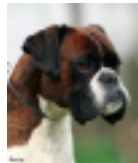
Matenhof's Blöf van Numado AKz: BH, AD