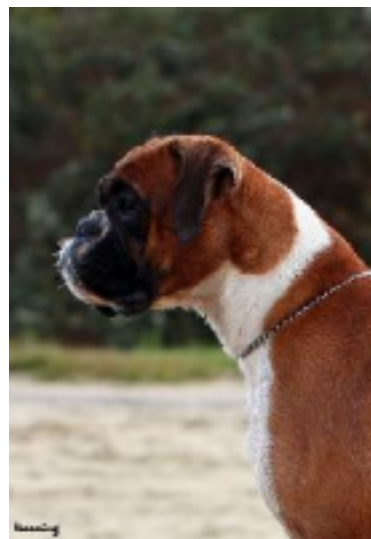
Blöf's Ninthe van de Legedyk