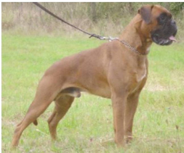
Ismo vom Hause Romeo

Wurfstag: 13.03.2001 Schaubewertung: vorzüglich Körung: ja Körungsstufe: A Wertmessziffer: - Größe: 60 Gewicht: Geschlecht: R Rasse: Boxer Ausbildungs-Kz.: AD, VPG 3 Zuchtbuchnummer: VDH / DBZB 218656 HD: HD-A1, Hz-0, Sp-0 Besitzer: Gerhard Fricke