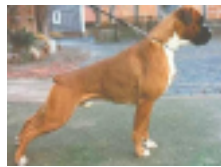
Balu vom Hause Romeo AKz: AD, VPG 3