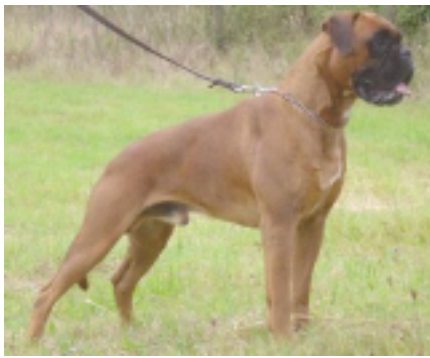
Ismo vom Hause Romeo Wurftag: 13.03.2001 AKz: AD, VPG 3